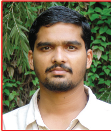
బ్రదర్ యస్. ప్రిన్స్ క్షేమియర్