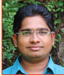
బ్రదర్ యం. శ్రావణ్